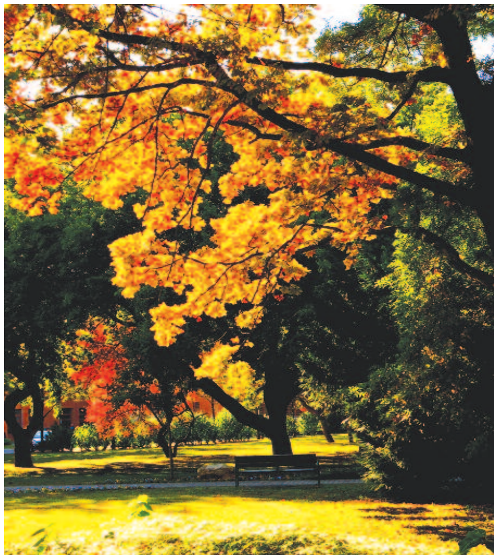
Túl a fák már aranykezükkkel intenek nekem

Marosvásárhelyen nevelkedett, itt kezdett növényeket gyűjteni – az első valódi botanikai kutatás vele kezdődött városunkban. Pesten bölcsészeti, Kolozsváron jogi, Bécsben orvosi tanulmányokat folytatott, majd 1844–50 között mint botanikus dolgozott a császári füvészteti múzeumban és füvészkertben. 1850 és 1865 között a Magyar Nemzeti Múzeum természetrajzi tárának őre volt. 1850-ben részt vett a Magyarhoni Földtani Társulat megalapításában, melynek első titkára lett. 1862-ben a botanika tanárává nevezték ki a pesti egyetemen. Tudományos munkássága során egyaránt foglalkozott a Kárpát-medence élő- és paleoflorájával. Kéziratban maradt fenn a Brassai Sámuellel együtt készített Új magyar füvészkönyve , amelynek részleteit azután Brassai és mások tették közzé. Fontos munkái közé tartozik Az ausztriai birodalom, különösen Magyarország és Erdély ritkább szárított növényei – benne marosvásárhelyi adatokkal, és az Ungarns fossile Flora.