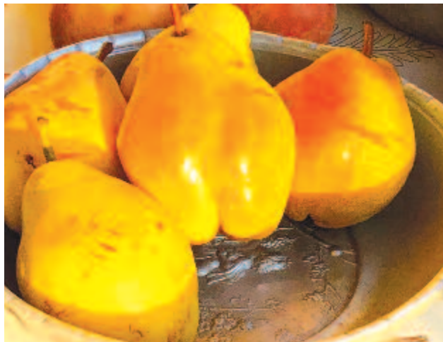
Ezt hozta az ős – hatalmas, jáspisfényű körtét

Szeptember közepén, 203 évvel ezelőtt, 1815. szeptember 15-én született Budán Kovács Gyula , a hazai paleobotanika megalapozója.